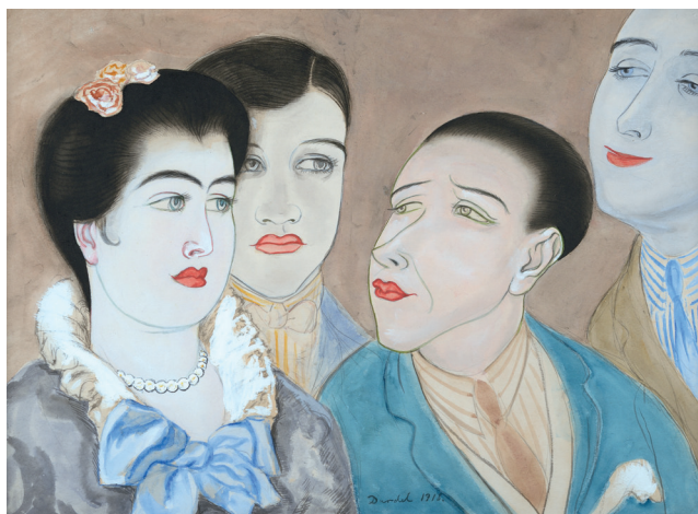
Eleganter i Japan, 1918

Intresset för den fantasifulle och excentriske konstnären Nils Dardel är idag större än på länge. Utställningen Nils Dardel och den moderna tiden som visades på Moderna Museet i somras följs nu av en mindre, men kompletterande, exposé i Åmells konsthandel på Birger Jarlsgatan 14 . Åmells utställning omfattar 30 representativa oljor, akvareller och teckningar som speglar hela konstnärens produktion. Några av dem har redan genom Åmells förmedling visats på Moderna, men i den egna utställningen ingår även viktiga verk som de privata ägarna inte velat avvara hela sommaren, eller som av olika skäl inte föll in under museets tema. Till dessa hör exempelvis tre målningar som tillkom som ett direkt resultat av Nils Dardels betydelsefulla resa till Japan 1917, Eleganter i Japan och Japanska I och II . Här finns också flera fina exempel på konstnärens porträttkonst från 1920- och 30-talen och på hans sena arbeten från Mellan- och Sydamerika. Merparten av de utställda verken är till salu , resten är privata inlån från Åmells kundkrets.