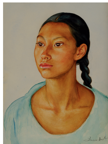
Ung mexikansk flicka, ca 1941

Till utställningen hör en 96-sidig, inbunden temakatalog . Den innehåller, förutom ett rikt bildmaterial, en inledande kronologisk presentation av konstnären och hans liv samt utförliga verkbeskrivningar, litteraturhänvisningar och redogörelser för utställningshistoriken för varje enskilt konstverk.