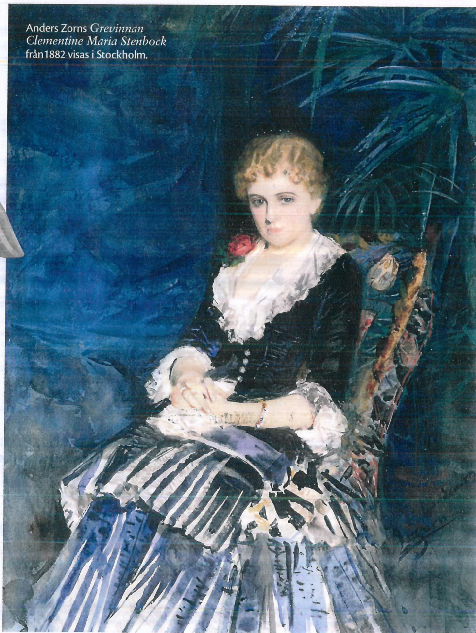
Anders Zorns Grevinnan Clementine Maria Stenbock från 1882 visas i Stockholm.