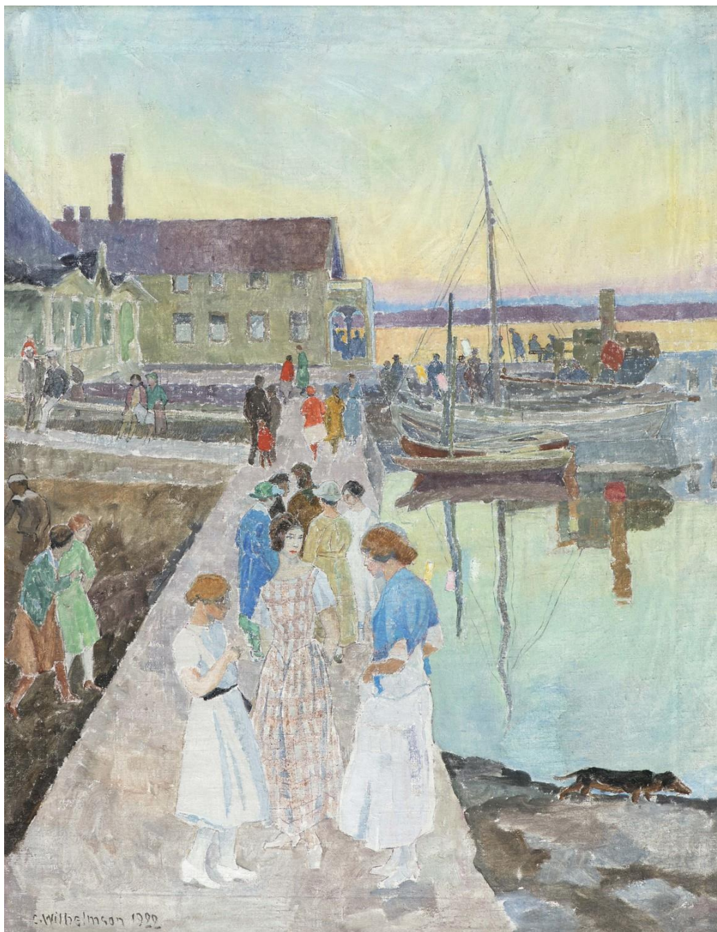
Carl Wilhelmson, På stora bryggan , 1922. Olja på duk, 78 x 61 cm